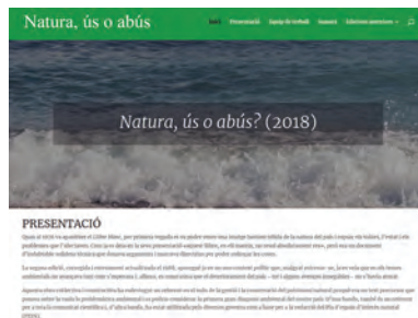
FOTOGRAFIA 35. Pàgina inicial de Natura, ús o abús?