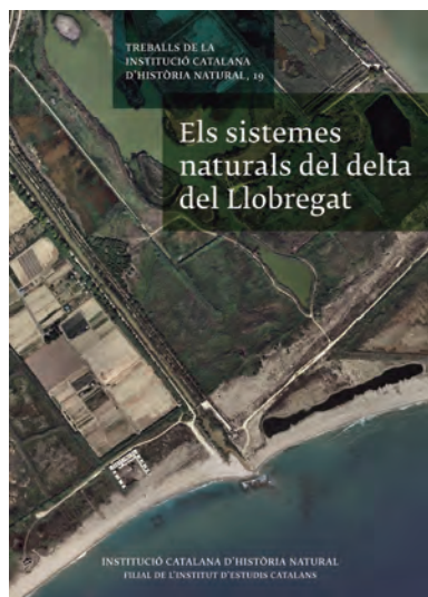
FOTOGRAFIA 34. Cobertura del llibre Els sistemes naturals del delta del Llobregat .