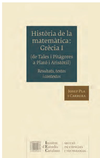
FOTOGRAFIA 36. Coberta de l'obra Història de la matemàtica: Grècia I (de Tales i Pitàgores a Plató i Aristòtil). Resultats, textos i contextos .