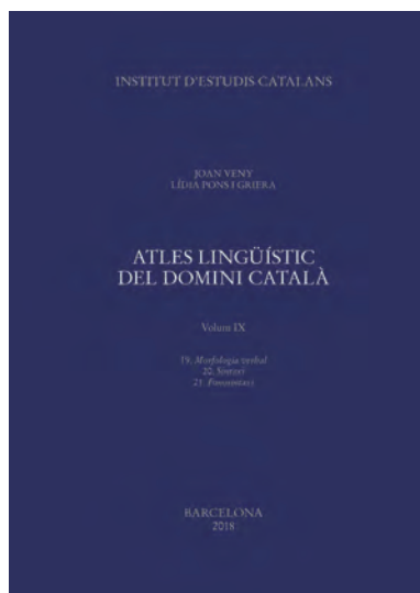
FOTOGRAFIA 37. Coberta del novè volum de l' Atles lingüístic del domini català .